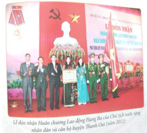
Lễ đón nhận Huân chương Lao động Hạng Ba của Chủ tịch nước tặng nhân dân và cán bộ huyện Thanh Oai (năm 2012)

Các cấp ủy đảng từ huyện đến cơ sở đã lãnh đạo, chỉ đạo quyết liệt và đã đạt được những thành tựu hết sức ấn tượng trong xây dựng nông thôn mới, 20/20 xã đã đạt chuẩn nông thôn mới; huyện Thanh Oai đạt 9/9 tiêu chí huyện nông thôn mới; diện mạo quê hương Thanh Oai không ngừng khởi sắc, đời sống vật chất, tinh thần của nhân dân không ngừng được nâng cao, dự kiến, hết năm 2020 thu nhập bình quân đầu người là 55 triệu đồng, tỷ lệ hộ nghèo còn 0,52%.