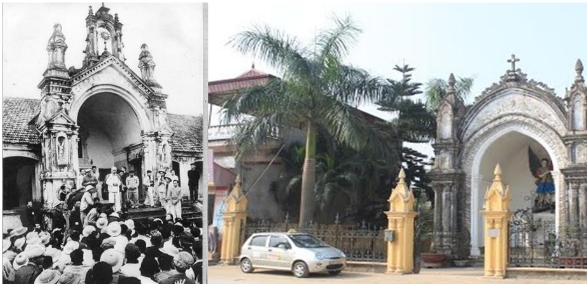
Bác thăm và nói chuyện với nhân dân, giáo xứ xã Bích Hòa xưa và nay 2015

Những lời dạy về đoàn kết của Bác làm cho bà con giáo dân vô cùng cảm động, xua tan những mặc cảm. Ai cũng thấy Bác Hồ gần gũi mình. Sau đó Bác đi thăm một cơ sở sản xuất của hợp tác xã, một gia đình giáo dân hoàn cảnh khó khăn và căn dặn địa phương phải chú ý giúp đỡ. Năm 2007, xã Bích Hòa đã xây dựng nhà lưu niệm, nhà bia để nhân dân địa phương luôn được thành kính tưởng nhớ đến Bác.