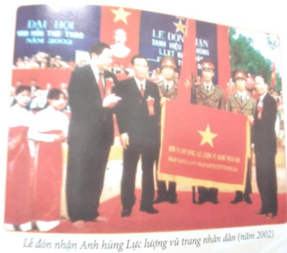
Lễ đón nhận Anh hùng Lực lượng vũ trang nhân dân (năm 2002)