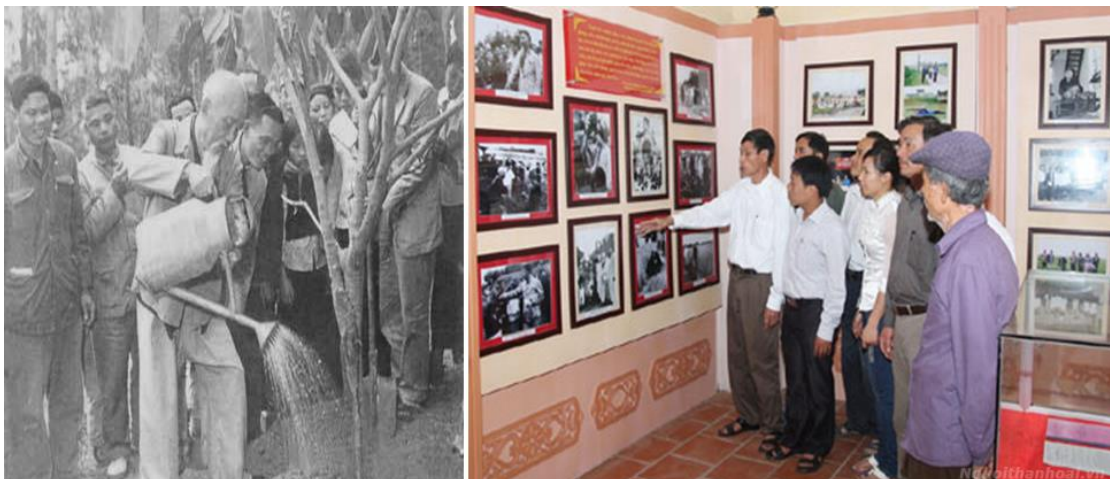
Lời Bác dạy và ngôi nhà lưu niệm Bác Hồ tại xã Xuân Dương