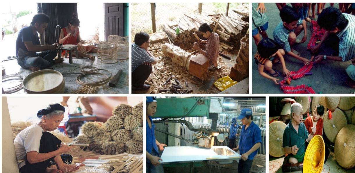
Một số làng nghề tại Thanh Oai - Ảnh: Phương Linh - Thanh Oai

Tính đến tháng 6/2020, Đảng bộ huyện Thanh Oai có 43 tổ chức cơ sở Đảng với 8.334 đảng viên trong toàn Đảng bộ. Toàn huyện có 20/20 xã đạt chuẩn Nông thôn mới, Trong đó có 01 xã đạt chuẩn Nông thôn mới nâng cao (xã Kim An). Đến nay, huyện cơ bản đạt 9/9 chỉ tiêu phấn đấu hoàn thành xây dựng huyện Nông thôn mới. Đặc biệt, phát huy thế mạnh từ sản xuất nông nghiệp, làng nghề, Thanh Oai đã vươn lên thành điểm sáng, thành vùng nông nghiệp trọng điểm của Hà Nội. Đến nay, toàn huyện đã có 14 mô hình nông nghiệp ứng dụng công nghệ cao; 11 sản phẩm đạt tiêu chuẩn OCOP chất lượng 4 sao.