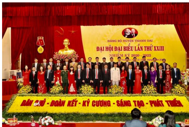
Đại hội Đảng bộ huyện Thanh Oai lần thứ 23

Đến nay (tháng 6/2020) Đảng bộ huyện đã trải qua 22 kỳ đại hội (Không tính thời kỳ huyện Liên Nam). Nếu tính cả đại hội đại biểu đảng bộ huyện nhiệm kỳ 2020 - 2025 là 23 kỳ Đại hội.