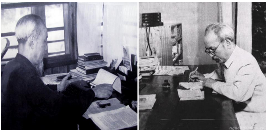
Bác làm việc soạn thảo những văn kiện quan trọng

- Ngày 02/01/1947, Bác viết thư khen ngợi tinh thần quyết chiến của các chiến sỹ bị thương, khen ngợi sự tận tâm của các y sỹ, khán hộ, cứu thương.