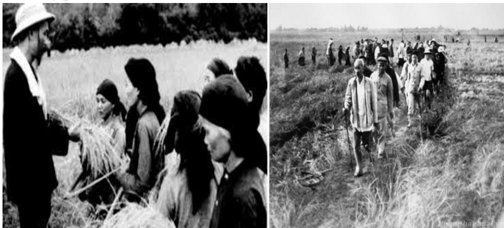
Bác Hồ thăm bà con nhân dân

Lần thứ hai , ngày 31/10/1959, Thanh Oai được đón Bác Hồ nhân dịp Bác về thăm hội nghị quản lý hợp tác xã nông nghiệp đoàn toàn miền Bắc họp tại xã Phương Trung. Trên đường về, Bác đã xuống thăm nhân dân xã Bình Minh đang gặt lúa ở cánh đồng Thượng. Bác xem kỹ khoảng cách giữa các khóm lúa và đếm số bông trong khóm lúa, số hạt ở một bông lúa và khen bà con thâm canh tốt. Bác thăm hỏi bà con xã viên về đời sống, về công việc làm ăn và căn dặn mọi người phải sản xuất tốt, cố gắng thu hoạch lúa cho nhanh gọn, tránh để rơi vãi lãng phí.